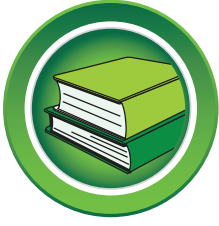
الرواد للتربية والتعليم Arrowad Educational