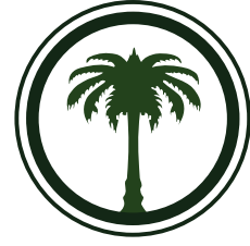
الرواد لبناء القيم Arrowad for Building Values